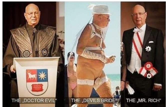
Klaus Schwab disfrazado de todo, Fuente de la Imagen en este sitio web

El seso apagado, y la inseguridad de las personas toma auge cuando la "palomilla" o el "grupo" se inventan su lenguaje, su código, sus modas, sus fuentes de noticias como se famoso "Morning Joe" y "The Young Turks", en México tantos que abastecen la misma mentalidad Woke "de élite", "alcurnia", "de la High", "con Clase" y todo atributo supremacista (notese el afan de SOMOS LOS MEJORES y USTEDES SON BASURA), el sello Nazi, el sello Fascista y Anti-democrático.